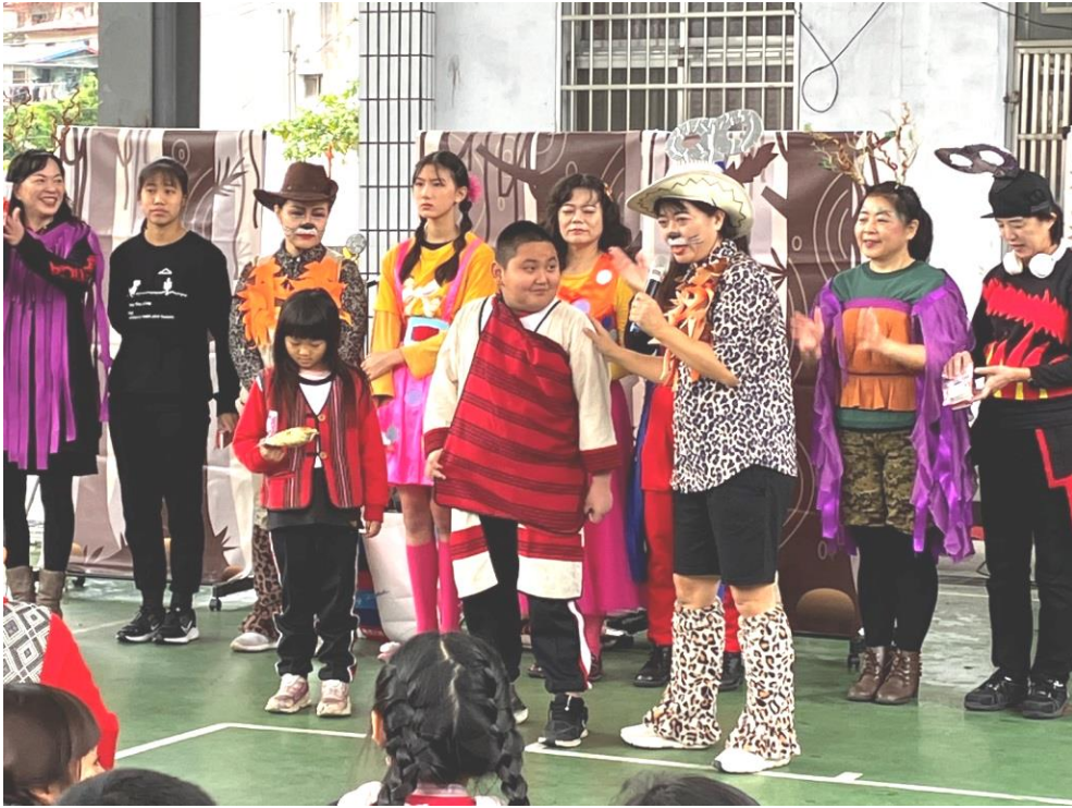
「情緒教育」戲劇展演活動，讓學生與老師學到不同的情緒詞彙與強度（相關計畫請參閱計畫 1-2-2）